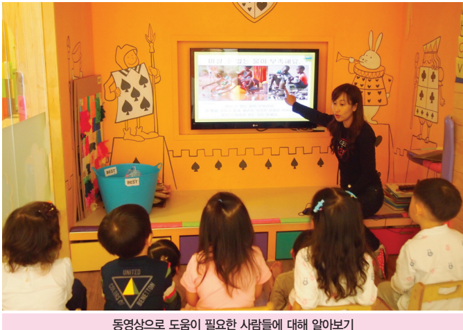
동영상으로 도움이 필요한 사람들에 대해 알아보기

이 가지고 있는 것 중에서 다른 사람에게 꼭 필요하지만 나는 잘 사용하지 않는 것 하나를 주는 것이다. 내가 가지고 있는 것들에 감사하고, 일상 생활 속에서 바로 실천할 수 있다.