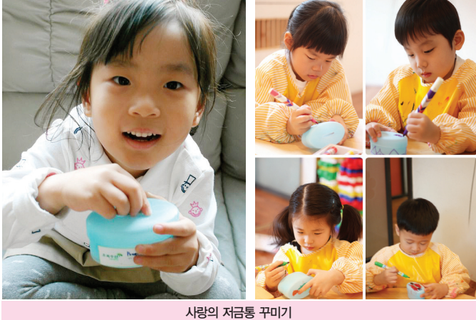
사랑의 저금통 꾸미기

이 가지고 있는 것 중에서 다른 사람에게 꼭 필요하지만 나는 잘 사용하지 않는 것 하나를 주는 것이다. 내가 가지고 있는 것들에 감사하고, 일상 생활 속에서 바로 실천할 수 있다.