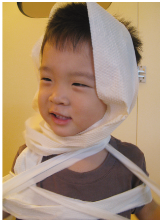
휴지를 찢고 나와요