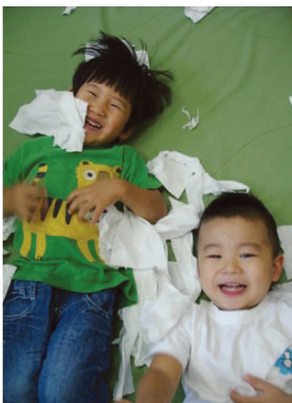
신나는 휴지 눈싸움