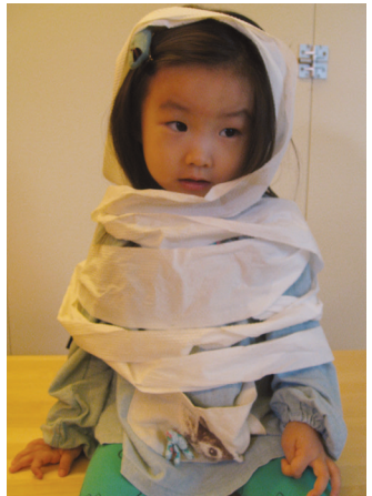
휴지를 몸에 감고 기다려요