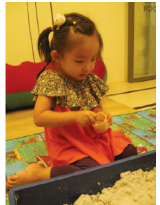
기다림 후 활동